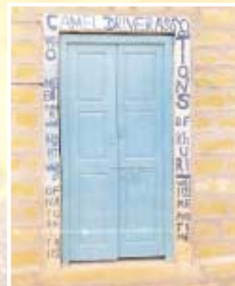
Isabel Alonso. Casa de la India

Más información: www.ucm.es/info/euoptica